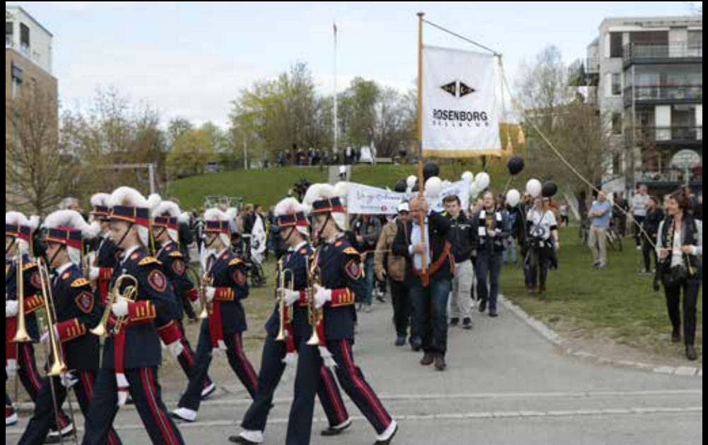
19. mai. 2017, Folketog fra stiftelsesstedet til Lerkendal stadion etter markering.