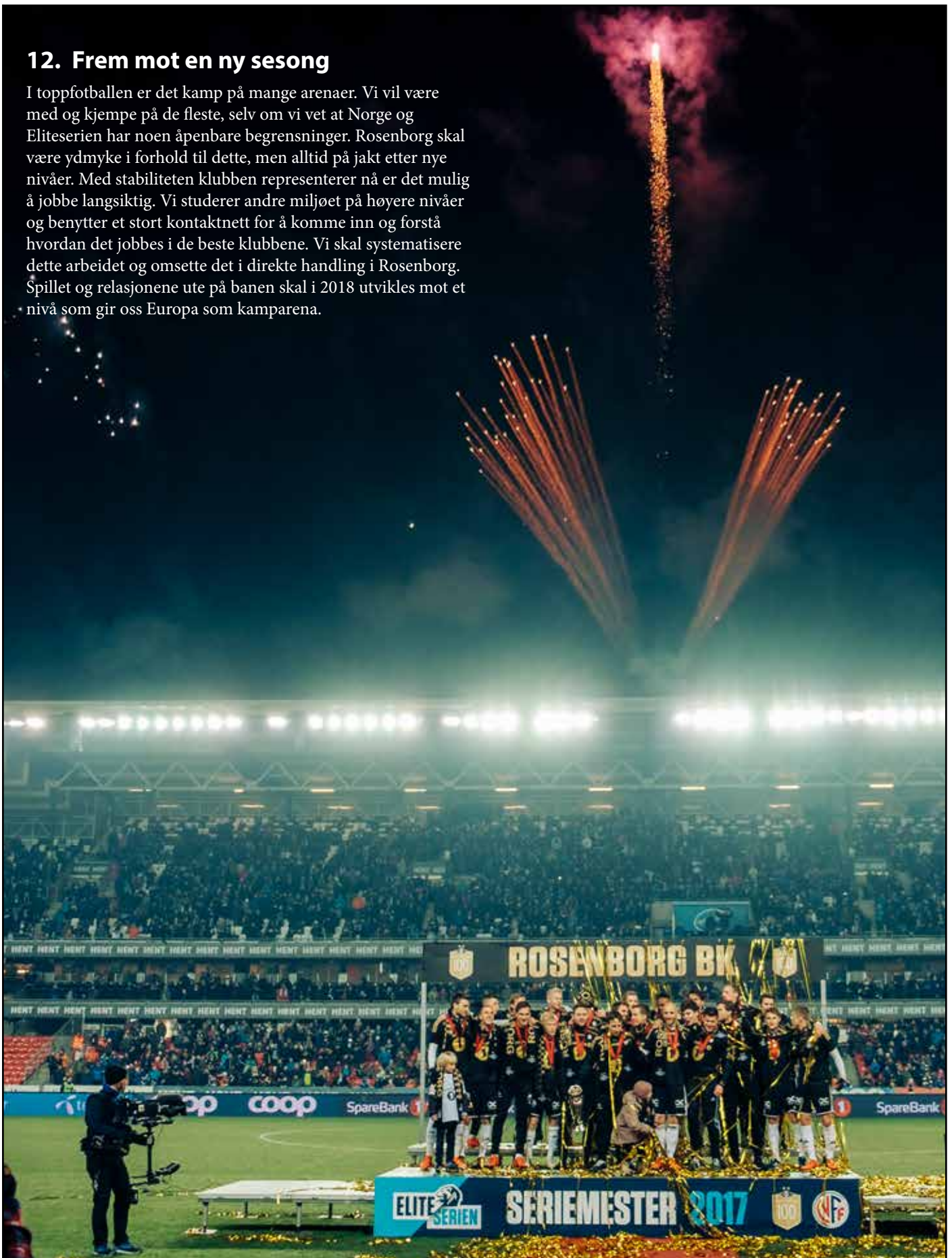
19. nov. 2017, Rosenborg mottar seriegull etter 2-0 over Viking i siste hjemmekamp.

I toppfotballen er det kamp på mange arenaer. Vi vil være med og kjempe på de fleste, selv om vi vet at Norge og Eliteserien har noen åpenbare begrensninger. Rosenborg skal være ydmyke i forhold til dette, men alltid på jakt etter nye nivåer. Med stabiliteten klubben representerer nå er det mulig å jobbe langsiktig. Vi studerer andre miljøet på høyere nivåer og benytter et stort kontaktnett for å komme inn og forstå hvordan det jobbes i de beste klubbene. Vi skal systematisere dette arbeidet og omsette det i direkte handling i Rosenborg. Spillet og relasjonene ute på banen skal i 2018 utvikles mot et nivå som gir oss Europa som kamparena.