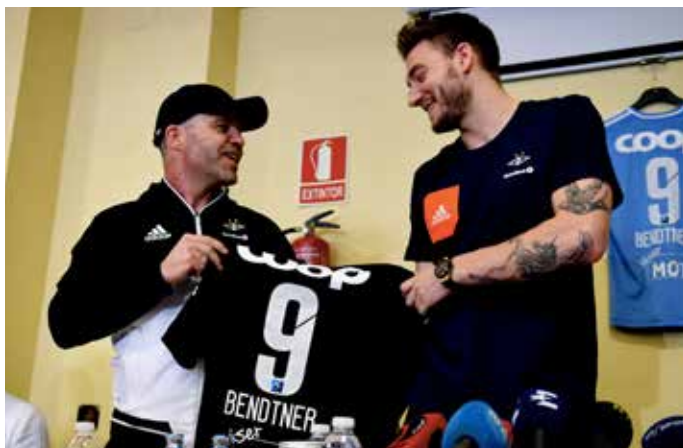
8. mars, 2017, Nicklas Bendtner presenteres

Vi gjennomførte to treningsleire etter samme mal som året før. Den første på Salobre, Maspalomas, Gran Canaria. Der har vi funnet fasiliteter som svarer til våre behov. Det er ro rundt oss, fine omgivelser, gode treningsforhold og korte avstander. Trenerteamet har utviklet et konsept med fokus på fotballspesifikk fysisk trening. Dette er nok å beskrive som tøffe saker, men spillerne opplever det som nyttig kapasitetsbygging foran en lang sesong. Og det er alltid et godt tegn når spillerne gleder seg til en slik leir – på tross av terskel-trening og en ikke ubetydelig grad av smerte over tid.