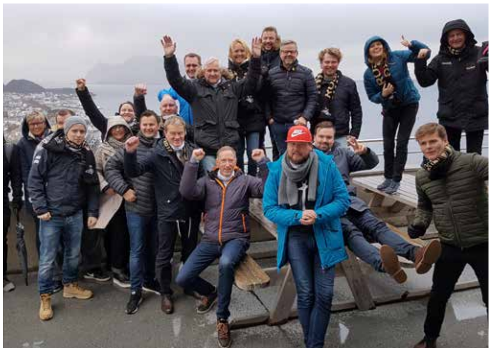
Partnertur med omvisning i Ålesund 4.–5. november

Vi merker en økende interesse for laget, etter en strålende 2017-sesong, og vi gleder oss veldig til 2018-sesongen sammen med våre mange fantastiske samarbeidspartnere og VIP-kunder.