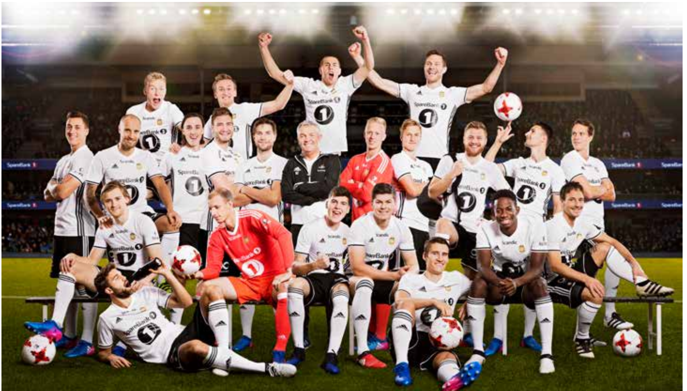
Lagbilde tatt for hovedsamarbeidspartner SpareBank 1 for sesongstart.