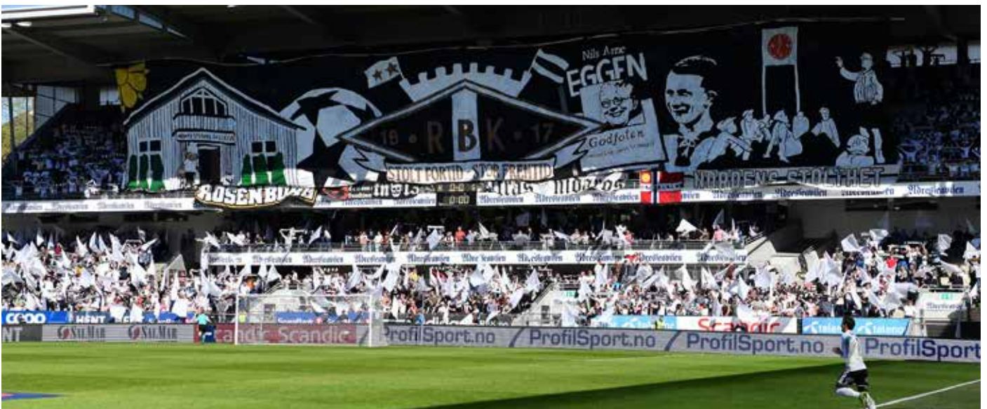
20. mai, 2017, Kjernens TIFO foran jubileumskampen mellom RBK og LSK.

Selv om 2017 var nok en jubelsesong, vet vi at vi må ha prestasjonsforbedring kommende sesong. De andre lagene blir bedre og er innstilt på å ta oss. Det skal vi utnytte til å bli enda bedre, både på banen, og i alt det andre vi gjør for å drive en klubb på denne størrelsen.