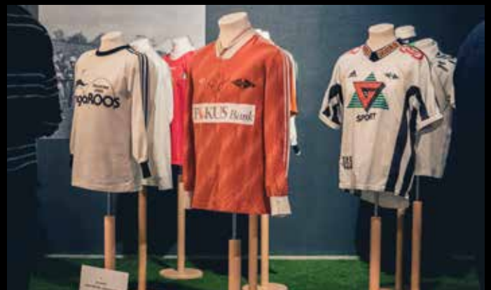
3. nov. 2017, Drakter fra flere tiår står utstilt.