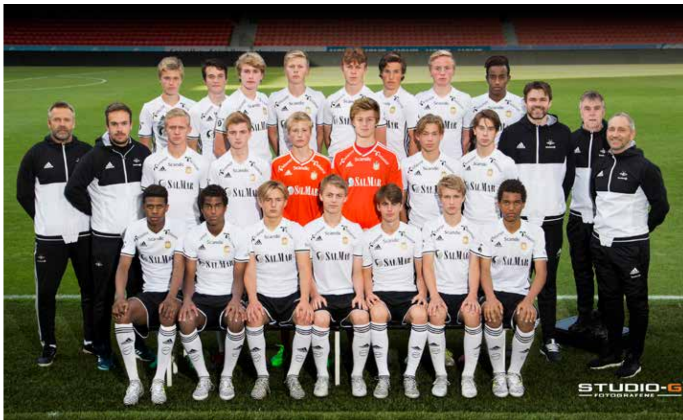
Lagbilde Rosenborgs gutter i 2017

RBK tapte i 4. runde hjemme mot Vålerenga. På veien dit hadde laget slått ut Sverresborg, Stjørdals/Blink og Strindheim.