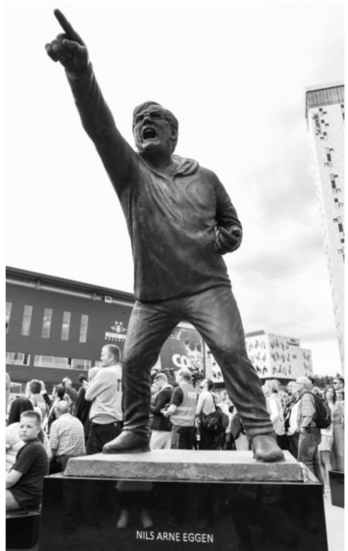
Statuen av Nils Arne Eggen.