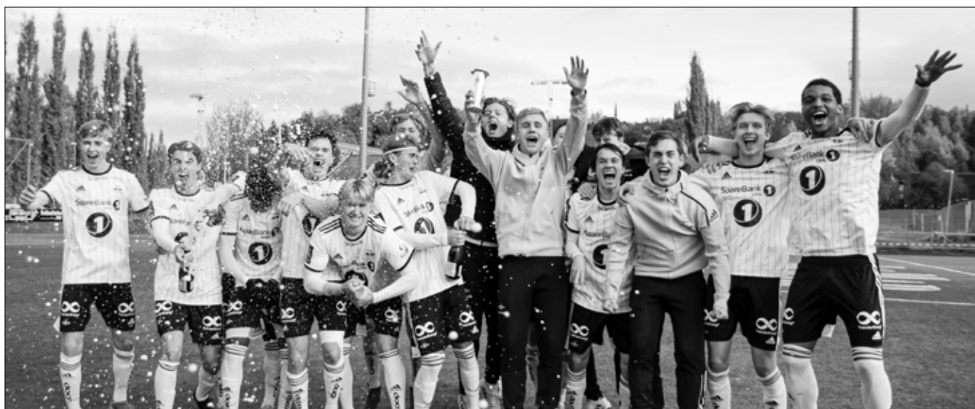
RBK2 løfter trofeet som seriemestere i Norsk Tipping-ligaen.